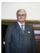
Henri Marie Jean André de Laborde de Monpezat

1934年、フランス南西部タランス生まれ。フランスの外交官として英国に赴任中、英国に留学中だった現女王と出会い1967年結婚。フレデリック皇太子ら2人の子をもうけた。2016年に公務から引退していた。